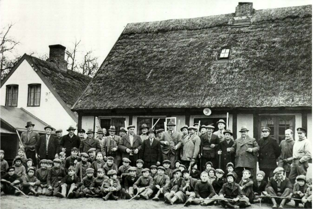
Fasanjagten i Kongelunden 1938. Foran sidder drengene, der var klappere