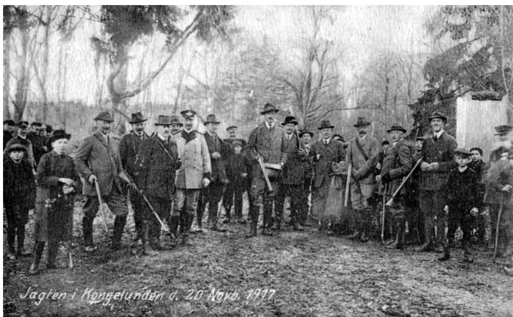
Konge­jagten i Kongelunden november 1917

Her blev det første egentlige vilde fasaneri til.