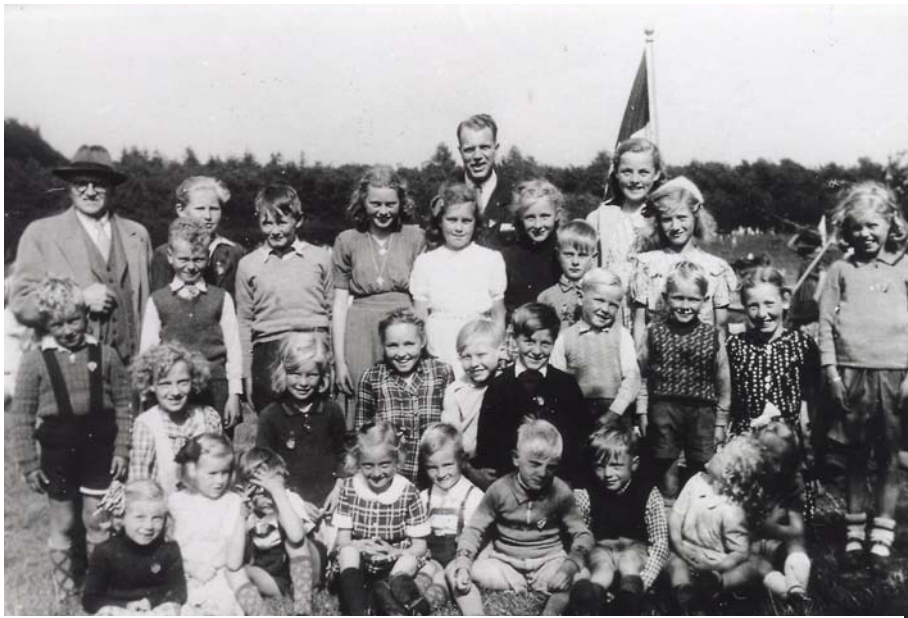
Luthersk Missionsforenings Menighedshus i Tømmerup bygget i 1934 foto ca. 1950

Fastelavnsmandag 1905 skete der en ny vækkelse på et møde hos