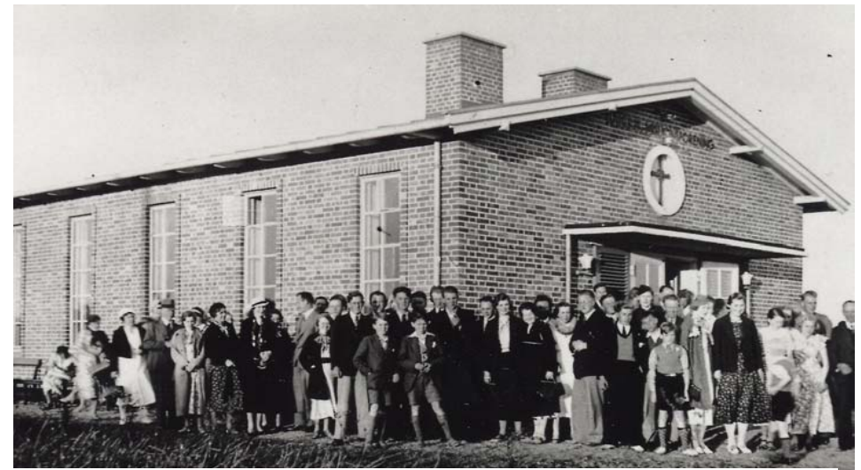
Luthersk Missionsforenings søndagsskole i Tømmerup 1925. Luthersk Missionsforening holdt søndagsskole på Tømmerupvej.