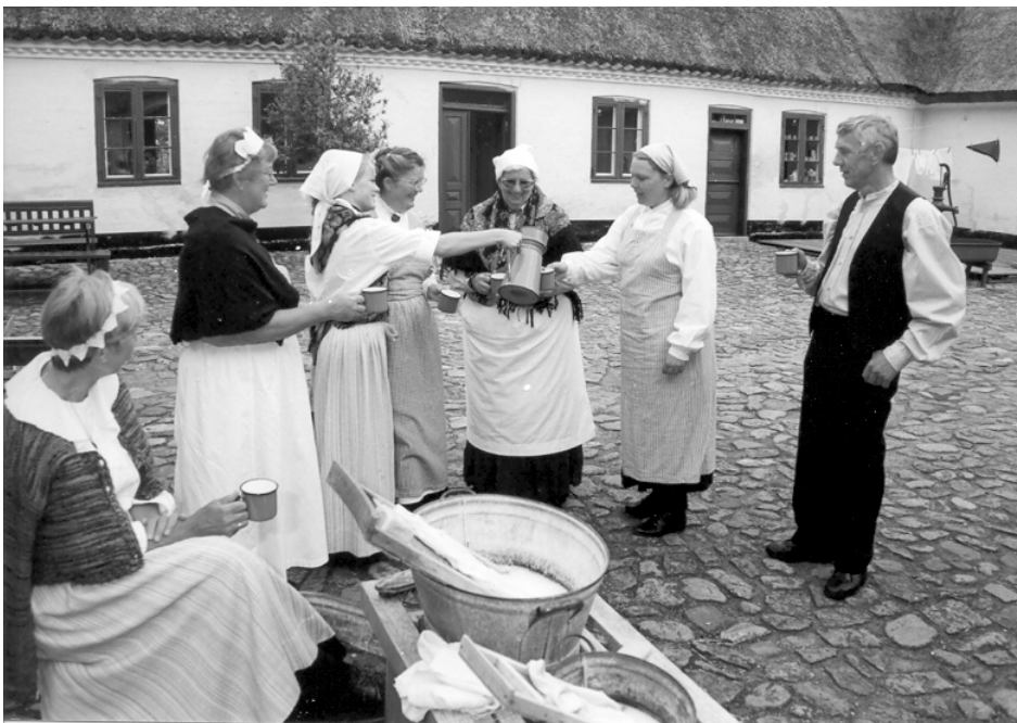
De frivillige karle og piger gør et besøg på Amagermuseet festligt, samtidig med at de også selv hygger sig.

Målet er, at Karle- og Pigegruppen med tiden skal være repræsenteret alle dage i museets åb-