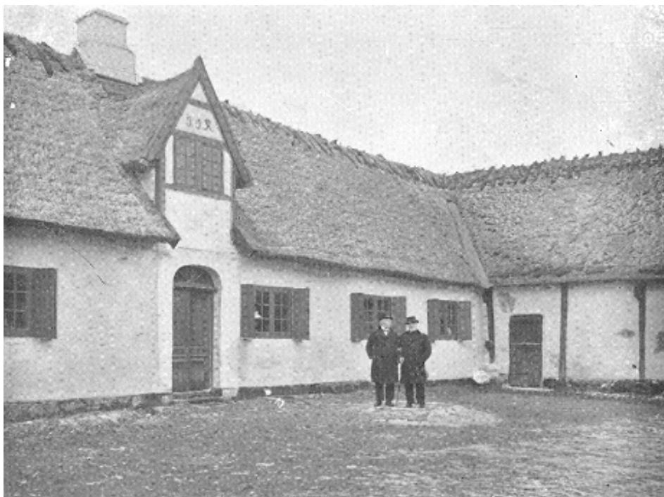
Stuelængen i museumsgården, Hovedgaden 12. - Foto ca. 1922.