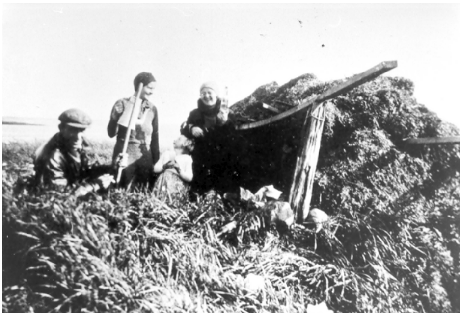
Tangen kunne også benyttes som dækningsmateriale til Grønsagskulerne eller som her en tanghytte på Nordre Klap.