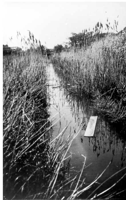
Grøft ved Slusevej ud til stranden. Foto Svend Christoffersen, ca. 1938.

Vi levede vel i det hele taget et farligt liv som børn, især set med nutidens øjne. Grøfter, vandhuller og strand kunne være risikable legepladser, men det var sjældent, at noget ellers gik galt. Det skulle da lige ske for mig endnu engang, ganske vist kun som noget, jeg har fået fortalt. For jeg har været højst et par år, da mine storesøstre kørte mig i barnevogn på Nordre Strandvej med de dybe grøfter. Nogle store drenge så sig sur på hende, så hun stak i løb med barnevognen efter sig. Resultatet var, at jeg kort efter lå i den dybe møllegrøft med barnevognen og det hele, men dog blev reddet op i tide og bragt til hægtterne hjemme på moders skød!