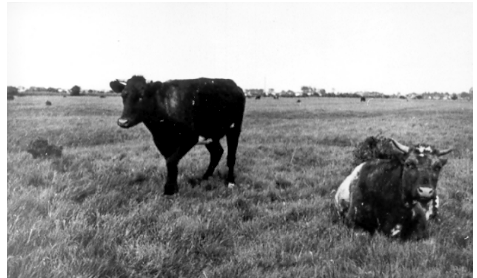
Køer på græs på Vestamager. ca. 1930.

til et sted, hvor vi måske skulle bruge dem. Sådant en stabel granater på 15-20 stk. var et herligt mål for stenkast, når man som vi havde anbragt os bag en solid meterhøj jordvold og var velforsynet med håndsten, som vi bombarderede granatdyngen med. Desværre lykkedes det os aldrig at få det helt store knald. Var det så ikke farligt? Jo, vi vidste da alle sammen, at et par skvadderhoveder havde båret sig kvajet ad med at skille en granat ad og nu gik rundt og var så mærkelige mørkeblå i den ene side af hovedet! Vi andre syntes blot, at granaterne var