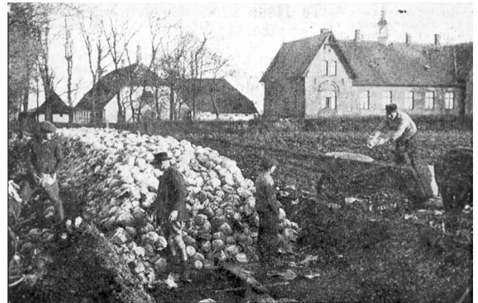
Hvidkålskule på Løjtegård, der måske har været dækket med tørv fra Tårnby Fælled. Ca 1900.

Enhver vil kunne forstå, at det er med vemod, man i dag genser de gamle steder, uanset at det naturligvis er prisværdigt, at myndighederne - i hvert fald indtil vide-