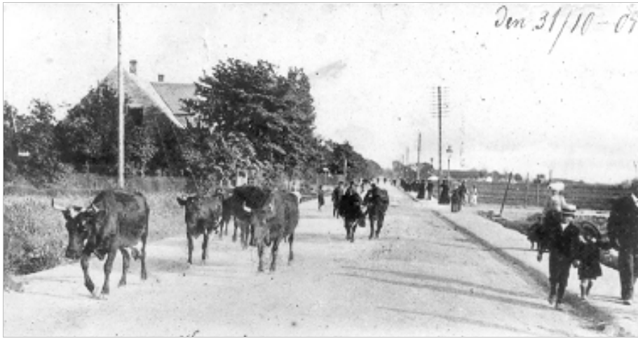
Køer på vej hjem fra Fælleden. - Amager Landevej 1904.

lavt, takket være kreaturerne, og det gav udmærket mulighed for at se et ejendommeligt fænomen, nemlig hundredvis af lave tuer, 30-40 ca. høje, kredsrunde og smukt hvælvede med en diameter på op til en meter. På visse områder, især nærmest ved indgangen fra leddet ved Finderupvej, lå de ganske tæt, så vi med lethed kunne springe fra tue til tue under de mange lege, vi opfandt derude. Af og til var de bøfler på prærien, som vi grumme og frygtløse indianere nedlagde med vore buer og pile, og andre gange var de glimrende grundlag for fangelege i mange variationer - undertiden med springstænger.