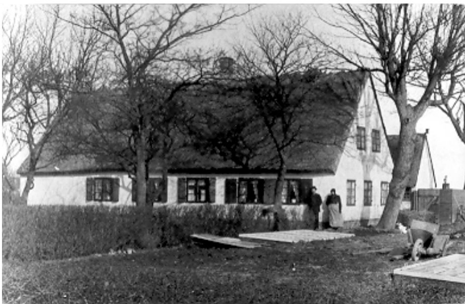
Cornelius Corneliussens gartneri, Amager Landevej 127 i Kastrup. Foto 1917.

Jeg fik dukkevogn, da jeg var 6-7 år, og isskøjter i julegave, da jeg var 8-9 år. Det lille postkontor med stempler var også som julegave, samt modellervoks i alle farver og viking farve med 12 i æsken, og farve og malebøger med farvelade. Undertøj af "Trico