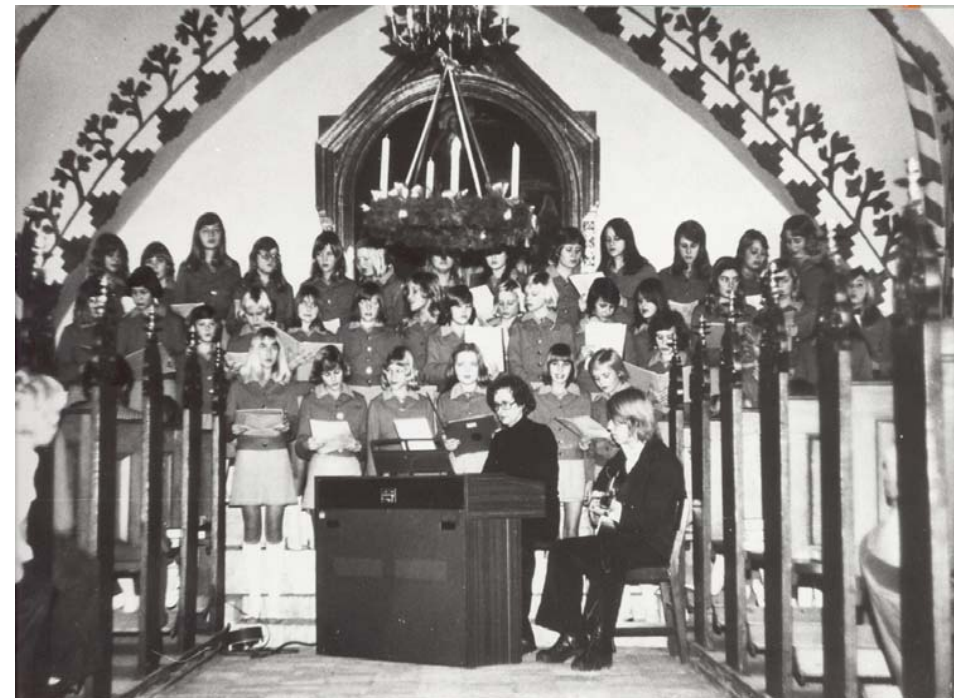
Julekoncert i Tårnby kirke i 1960'erne

Som mindre børn fik vi næsten altid legetøj, puslespil o.s.v. Jeg fik i 1940 prinsesse Margrethe som puslespil. Der blev også givet Knold og Tot bøger og Prins