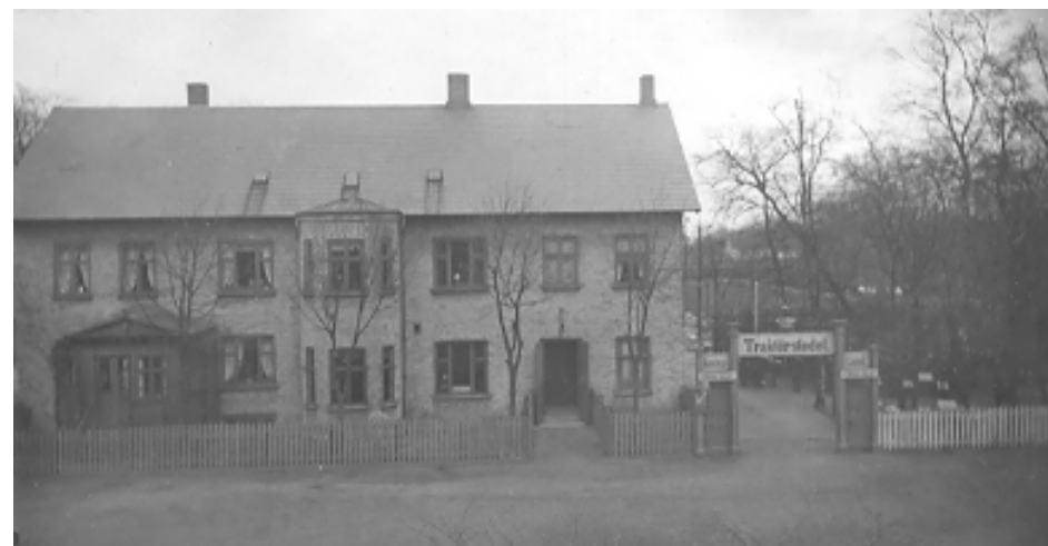
Kastruplund, ca. 1900.

Røde Kro var et populært teater for specielt beboerne på Amager, men teateret måtte vige pladsen