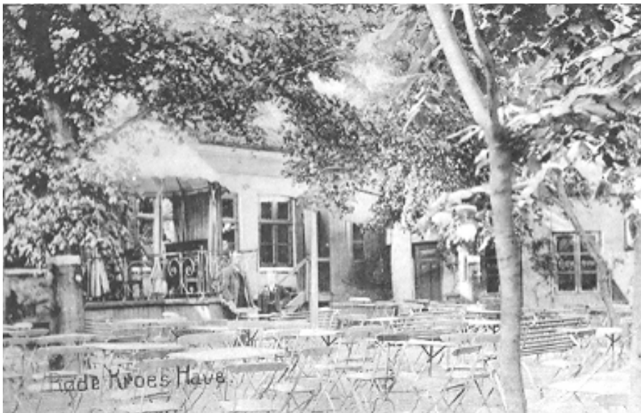
Røde Kros have – 1910.

De første teaterstykker på Røde Kro blev opført i 1878, der blev blandt andet opført en farce i 3 akter. I 1885 til 1887 blev der spillet revyer, og endelig i 1888 blev repertoiret et ganske andet, da man opførte Strindbergs ”Faderen”. Det var den spæde start på et teater, der eksisterede til 1961.