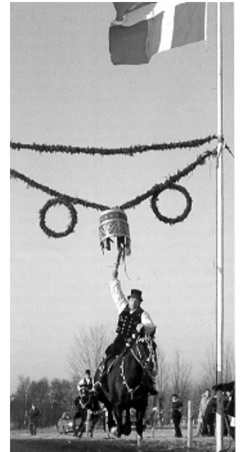
Tøndeslagning på Fægårdsvej. 1994.

chokolade og et fastelavnsris. Derefter spilles og synges "Åh Amagerland". Turen går herefter videre med besøg de sidste 12-15 punchesteder, de første par steder med tøndedronningen siddende foran hos tøndekongen. Kl. ca. 18.30 er vi færdige med ridningen. Hestene sættes i stald, strigles og pudses, de får desuden et godt foder med tak for en god