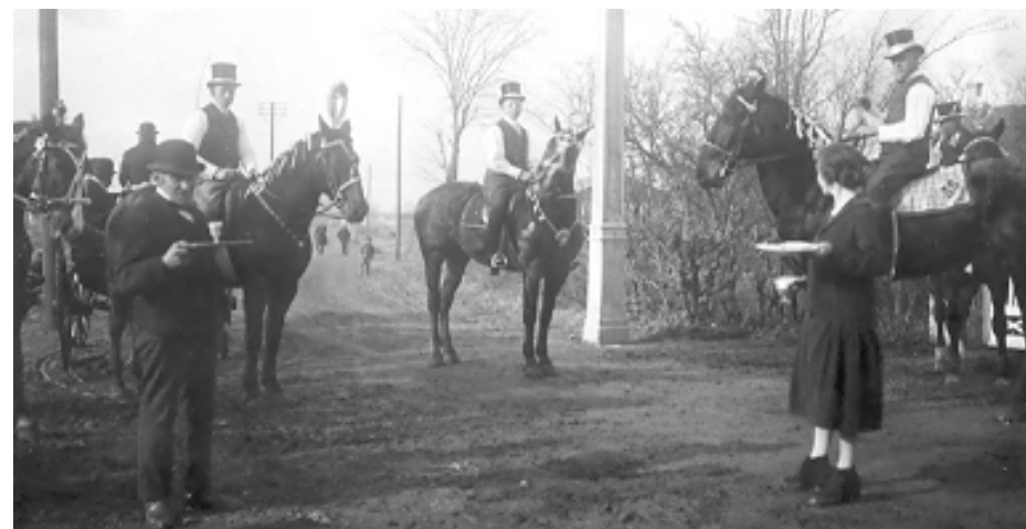
Fastelavn i Maglebylille. ca. 1935