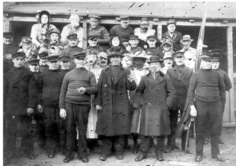
Kastrup Broforenings medlemmer til fastelavnsfest i ca. 1916.

Fastelavnen huskes som en grufuld oplevelse, for så blev der traditionen tro lavet posegrød. En stor udbenet skinke blev kogt i rigeligt vand. Når vandet kogte, blev der sænket en lærredspose indeholdende mellemfine byggryn, citronskal, sukker safran, rosiner