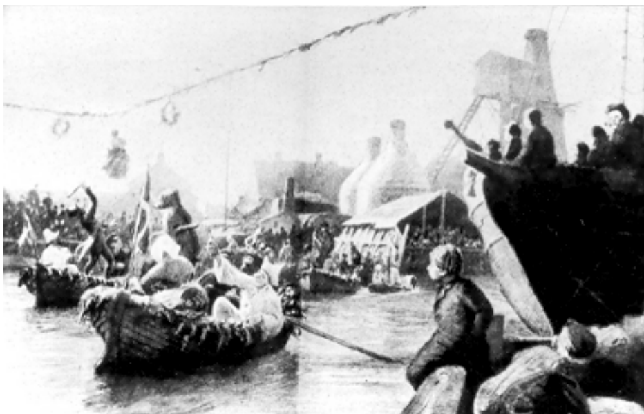
Tøndeslagning i Kastrup havn, efter maleri af Chr. Mølsted. Ca. 1900.

Året efter deltog 40 fiskere i forskellige kostumer anført af en admiral til hest. Hans mandskab bestod af matroser i hvide skjorter med røde skærf, gamle koner og unge piger med cigarer i munden, bønder i gamle dragter, klovne, harlekiner m.m. Påstanden om at glasmagere og fiskere ikke kunne sammen, passer i hvert fald ikke ved denne lejlighed, for Glasma-