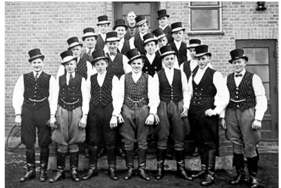
Salonskytteforeningen Maglebylille. 1945.

Den sidste tøndeslagning i Maglebylille fandt sted i 1953..