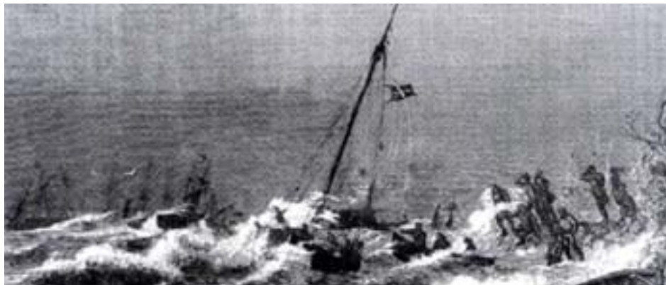
Pynten ved Langelinie ved stormen i 1872.

Fader tog et Par Dækkener i Favnen og sagde, at jeg skulde følge efter ham. Han vidste nemlig, at der var en Jordvold langs Vejen. Med Besvær kom vi op begge to. Fader gik foran uden at ane, at et Stykke Jordvold var revet bort. Her traadte han ned med Dækkenerne og faldt helt under Vandet - nu fik Dækkenerne Rejsepas og var snart borte af Syne. Vi naaede endelig hen til Gaarden, hvor vi fik en Vogn til Laans, for derefter saa hurtigt som mu-