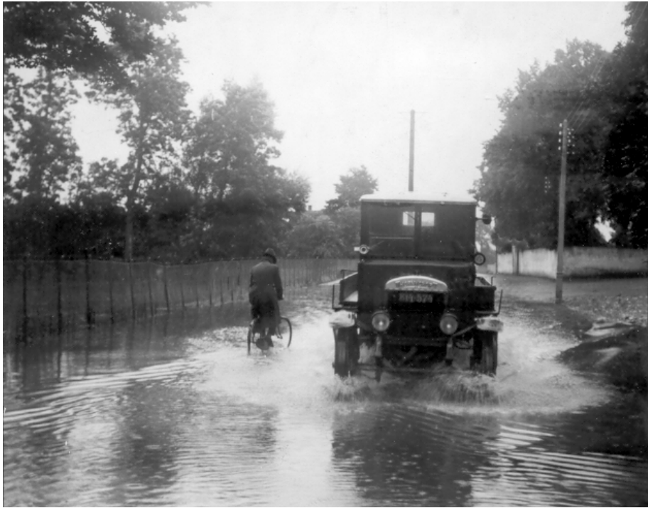
Englandsvej ud for Tårnby Kirkegård oversvømmet i august 1927.