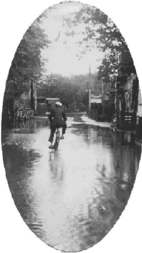
Englandsvej, ca. ved nr. 324, 1927.

ske værdier, der gik tabt. Jorderne blev ødelagt for flere år. I byerne Ullerup og Tømmerup havde gårdene markjorderne at falde tilbage på. Men vandet havde stået højt på Ullerup strandlæg.