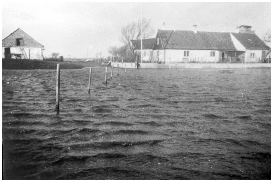
Højvande ved Bergmanns gård på Saltholm, 1941.

St. Magleby Fællede. På Raagaards jorder imod Kongelunden og ud over St. Magleby Fællede gik bølgerne som vi ellers ser dem i storm ved stranden. Vi fik senere at vide, at beboerne på det oversvømmede område sad på lofterne. Der blev smagt på vandet, og det viste sig at have en meget stor saltprocent. For St. Magleby Fælleds beboere blev det en frygtelig katastrofe. Brøndene løb fulde af saltvand, varerne i kulerne blev ødelagte flere steder, der druknede mindre dyr samt harer i Kongelunden og på jorderne. der var store økonomi-