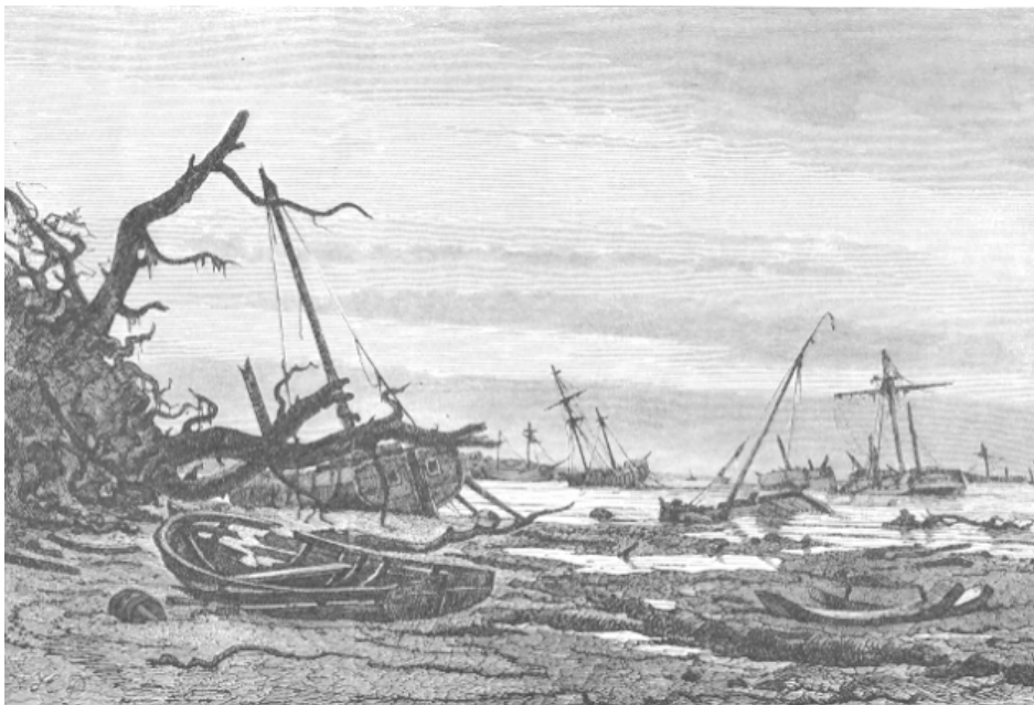
Tegning af Holger Drachmann fra Bønsvig strand, Præstøbugten efter stormfloden 1872.

met, 80 mennesker omkom og 50 skibe strandede på Sjællands østkyst. Den helt usædvanligt høje vandstand på omkring 3 meter over normalt daglig vande var resultatet af en meget langvarig og særdeles kraftig østenstorm.