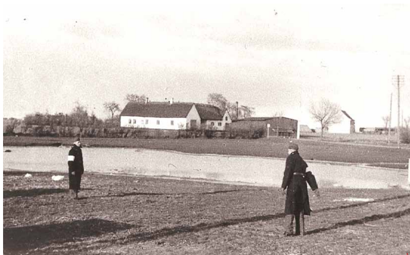
To civilbetjente patruljerer ved gadekæret i Maglebylille under besættelsen. Måske er den ene Anker Jespersen. Foto: 1941.