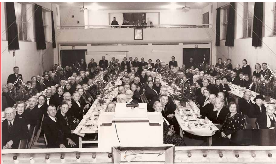
De gamles jul på Teknisk skole i 1943.