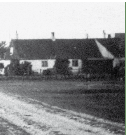
Barakkebatteryet. Til venstre stenladen og kikkertstation, til højre Barakkegården. Foto: P. Due, 1933