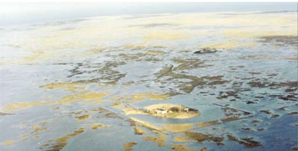
Saltholm Batteriet også kaldt for Fortet under en oversvømmelse i 1962. I baggrunden anes Gammelværk.

Mandskabet boede som nævnt i nyopførte kaserne men også på loftet i den stenlade, der nu rummer museet. Her var også "remise" for lokomotivet og en temmelig sprængfarlig underbo nemlig ammunitionsmagasin.