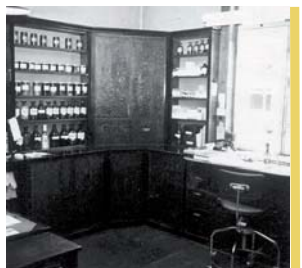
Receptionen. Ca. 1958.

Min første dag husker jeg meget tydeligt, jeg skulle lære at tarere (stille vægten tilbage på 0) papdåser og veje tvekulsur natron og karsbadarsalt af i 2 størrelser. Natron i lyserøde og karsbadarsalt i lysebrune dåser. Samtidig blev der fortalt mig, at hvis man spildte