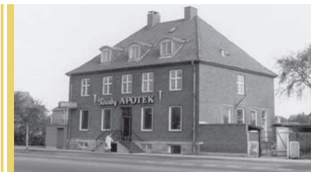
Tårnby Apotek, Amager Landevej 37. Ca. 1950.

der. Så syntes min mor, at jeg skulle i huset og lære noget rigtigt. Jeg kom til en lægefamilie på Amagerbrogade, hvor jeg også skulle hjælpe doktoren i konsultationen. På den tid havde jeg fået i hovedet, at det kun kunne være sygeplejerske, jeg skulle vie mit liv til. Jeg var knap 16 år og blev der kun i 4 måneder. Min mor var af den fornuftige slags, der mente at man uanset dreng eller pige skulle lære et fag og kunne noget. Hun havde aldrig selv fået lov til dette. Hun var fra gården "Fremtids Håb" Amager Landevej 76, nøjagtig der hvor nu vores Rådhus i Tårnby Kommune ligger.