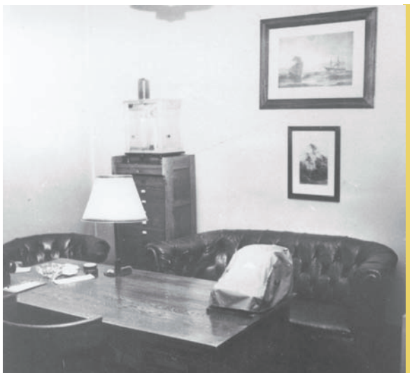
Apotekerens kontor. Ca. 1958.