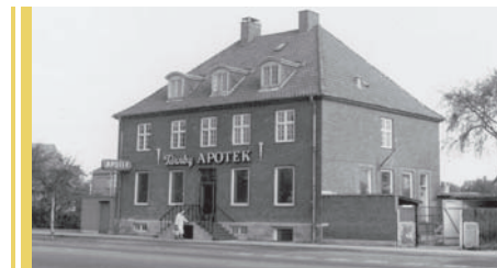
Tårnby Apotek, Amager Landevej 37. Ca. 1950.

der. Så syntes min mor, at jeg skulle i huset og lære noget rigtigt. Jeg kom til en lægefamilie på Amagerbrogade, hvor jeg også skulle hjælpe doktoren i konsultationen. På den tid havde jeg fået i hovedet, at det kun kunne være sygeplejerske, jeg skulle vie mit liv til. Jeg var knap 16 år og blev der kun i 4 måneder. Min mor var af den fornuftige slags, der mente at man uanset dreng eller pige skulle lære et fag og kunne noget. Hun havde aldrig selv fået lov til dette. Hun var fra gården "Fremtids Håb" Amager Landevej 76, nøjagtig der hvor nu vores Rådhus i Tårnby Kommune ligger.