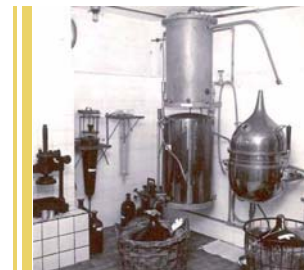
Laboratoriet med kobberkedler og pressen, som blev brugt når udtrækket havde stået længe nok. Ca. 1958.

Der var også mange store og små rustfrie stålskabe og porcelænsmortere i flere stør-