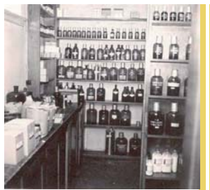
Tinctuskælderen eller den kolde kælder. Ca. 1958

Lige overfor under trappen var damernes garderobe, et lille sørgeligt hul med 6 kna-