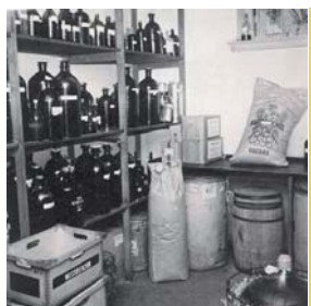
Lagerkælder med 5- og 10-liters grønne flasker, tønder og syrebeholdere. Ca. 1958.

stykker og smagte virkelig godt. Nu var det ikke alting, jeg turde smage på, men netop dette tog jeg en lille bid af med mellemrum og suttede på, når ærindet faldt for. Det skulle senere vise sig at jeg fik en voldsom diarré, og så var det slut med mannaen. Det var også godt at smage på og tygge hørfro ved påfyldninger, de smagte som nødder, men som bekendt gav dette jo samme virkning.