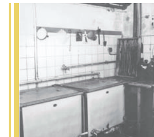
Skyllekælderen. Ca. 1958.