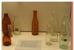
Forskellige mælkeflasker fra Kastrup Glasværk udstillet på arkivets glasudstilling på Kastrupgård.

munens 7 sundhedsplejersker, der tilbød deres gratis assistance til de nybagte forældre, ligesom i dag. Hvis der var svær sygdom i hjemmet, kom hjemmehjælpen gerne på besøg.