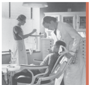
Skoletandlægen er i gang med at behandle en lille patient. Ca. 1935