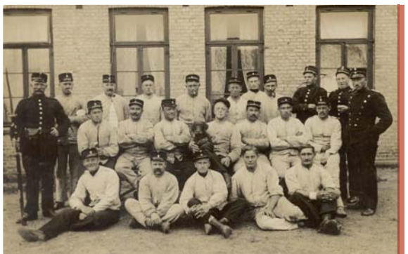
Kolerahuset i Maglebylille blev under 1. verdenskrig benyttet til indkvartering af soldater fra sikringsstyrken. Ca. 1918

teret i Bachersmindelejren og Ulleruplejren blev også syge og blev flyttet til et epidemihospital inde i København.