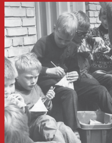
Skolemælk i karton drikkes af drenge på en af Tårnby skoler. Ca. 1965

De første flasker blev lukket med korkprop, der blev afløst af papskiven i 1909. I 1930'erne kom der kapsler på mælkeflaskerne samtidig med at man indførte standardflasker for alle mejerier. I 1959 begyndte man at producere brune flasker til enkelte dele af landet. I 1962 indførte man kartoner til skolemælken i København og nogle år senere indførtes plastik og papkartoner til emballage af mælken, og dermed var mælkeflaskernes tid forbi.