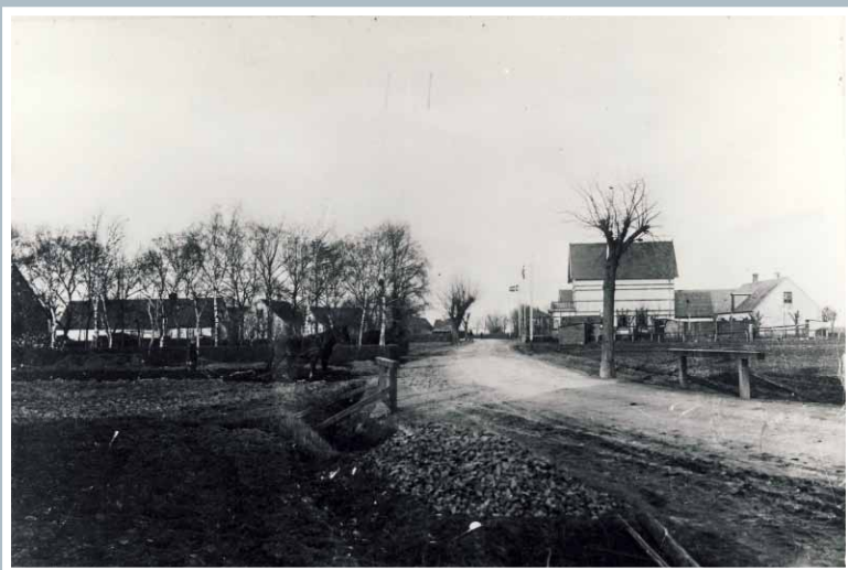
Tømmerupvej i 1920'erne. Til venstre ses gården ved det nuværende kryds Engelslandsvej - Tømmeupvej og til højre Tømmerup Kro