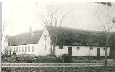
Hjørnegård på Tømmerupvej. Ca. 1925