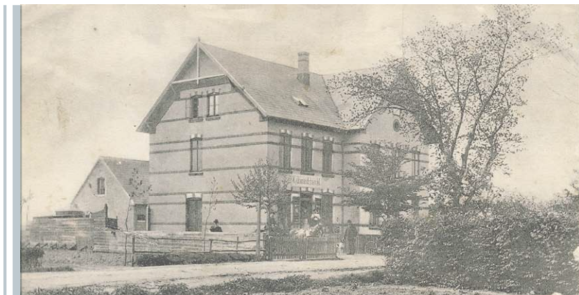
Tømmerup Kro og købmandshandel. Ca. 1910

Adgangen til købmandsbutikken foregik ad en stentrappe. I butikken var der en treleddet disk med kasseapparat og vægte. Bag disken var der mange skuffer til mel, gryn, salt, sukker m.v., der solgtes i løs vægt. På hylderne stod mærkevarerne. I det ene vindue stod kaffemøllen. I et hjørne stod en stor tromle med en lille pumpe ovenpå til brug for salg af petroleum i dunke. Der var stadig enkelte, der kom for at købe petroleum til belysning, ligesom flere købte petroleum til opvarmning i petroleumsovne. Bag butikken var en mellemgang, der førte ind til krostuen og til et værelse med køkken, hvor fru Ellen Schmidt gerne sad og fik sig en cigaret, når der ikke var kun-