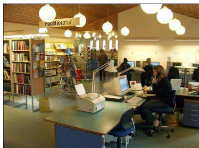
Filial Kastrupgård.

relse af en ny sidefløj mod syd og restaurering af den sydlige portbygning til indretning af et kunstmuseum, Kastrupgårdsamlingen, der blev indviet i 1977. I det efterfølgende årti ændredes indretningen, bl.a. blev 2 rum i hovedbygningen omdannet til café og udstilling med Th. Philipsens arbejder. Med udgangen af 2006 lukkede biblioteket på Kastrupgård.