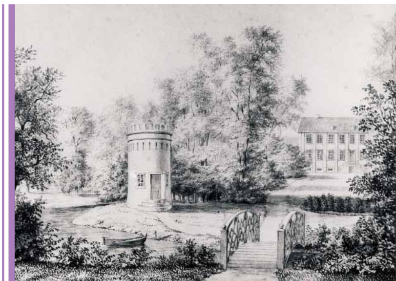
Haven på Kastrupgård. Tegning af ukendt kunstner ca. 1840.