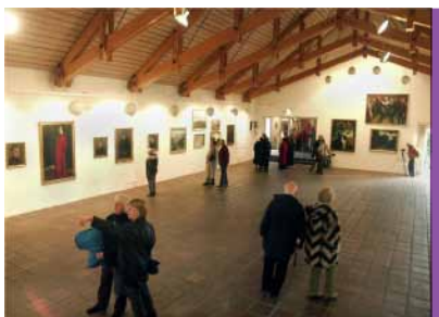
Kastrupgårdsamlingen. Foto: Dirch Jansen, 2003

Jeg er født i København i 1942, og vi boede dengang i Fredericiagade. Min biologiske far døde den 1. maj 1944, så mine erindringer om ham er meget