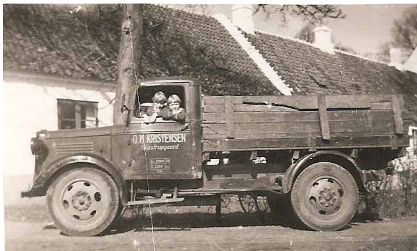
Kastrupgårds lastbil. Ca. 1953

mester var gået, kunne man jo altid grave skoddet op. Han rullede selv sine cigaretter, det bedste var, hvis der på lokummerne var glemt noget toilet-papir 00, så brugte han dette. Ellers måtte han ty til lidt avis-papir.