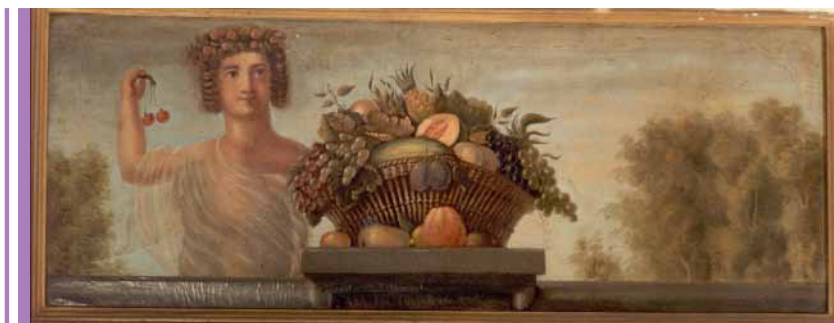
Et af de fire dørstykker fra salen på Kastrupgård. Dørstykkerne var malet af W.F. Burfeldt i 1753.

Fortling fik et omfattende landbrug ved siden af fabriksvirksomheden Kastrup Værk, i kraft af omfattende jordkøb i Kastrup, Maglebylille og Sundbyøster. Han lagde med sin fabriksvirksomhed i Kastrup grundstenen til den industrielle udvikling i Kastrup. I gavlen på portbygningen er det følgende minde skrevet i saltholmsmarmor. Her oversat fra latin: