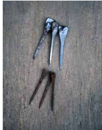
Brodder øverst samt almindelige søm nederst til hestesko

Arbejdet i smedjen var i den grad præget af amagerens arbejdsredskaber, såmaskiner, hesteomgange, plove, harver, og lugeknive blev repareret eller nye fremstillet, det samme gjaldt deres vogne f. eks stivvognene.