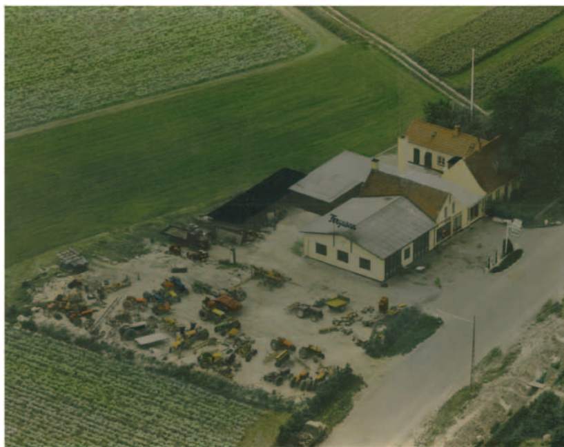
Luftfoto fra 1950'erne med de mange traktorer af mærket Ferguson