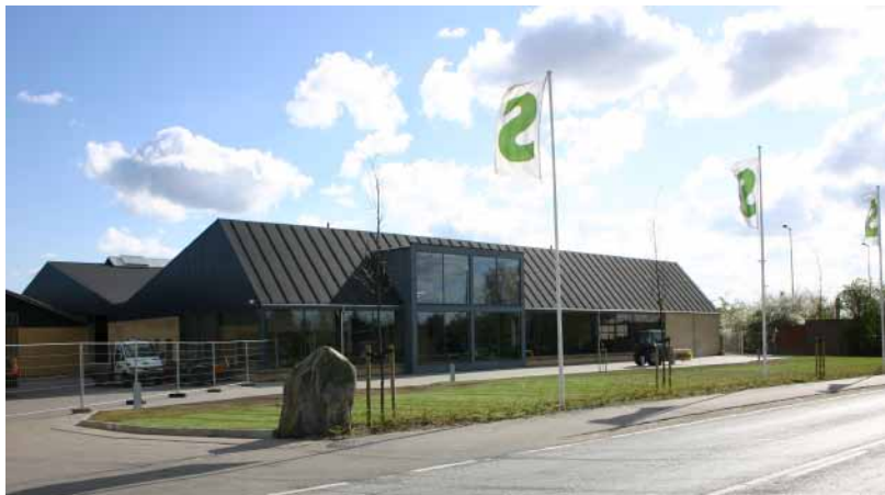
Svenningsens anno 2011