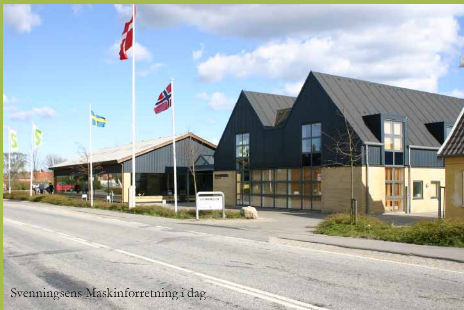
Svenningsens Maskinforretning i dag