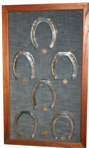
Hestesko som er mesterstykker fra flere generationer af smedeslægten Svenningsen.