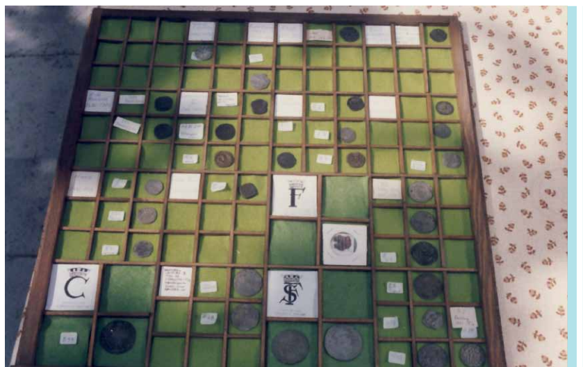
En udstilling af mønter.

andre på romermønter, og andre igen samler på bestemte motiver. I foreningen er auktionerne opdelt efter geografi, så samlere af danske mønter umiddelbart har kunnet finde ud af, om de skulle byde på en mønt. De fejlfri eksemplarer er de dyreste, hvorimod de slidte mønter kan være værdiløse for en samler. For forskerne kan det omvendte godt være tilfældet, idet den slidte har en historie. Også udstillingerne har temaer som f.eks. sjældne og efterspurgte mønter.