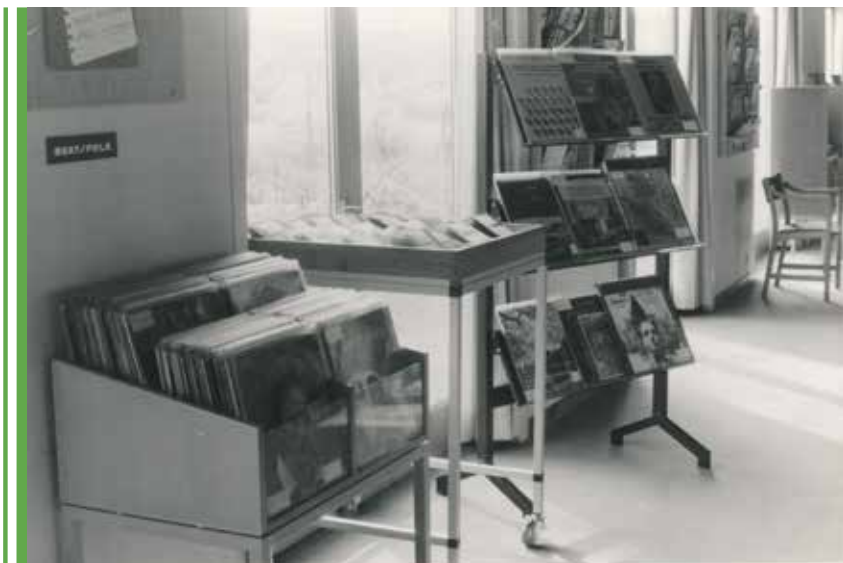
Filialbiblioteket på Kastrupgård fik også en musikafdelingen. På skiltet står: Beat / Folk. Fotograferet i 1972.

I den forbindelse er det værd at huske, at det foretrukne udlånsmateriale, nemlig lp-pladen, bestemt ikke var egnet til udlån og afspilning hos diverse lånere. Ældre læsere vil mindes, hvordan f.eks. musikken i Danmarks Radio kunne være en ren plage at lytte til, når det ikke var udsendelser med levende musik, men når der ”blev lagt en plade på”. Selv om lp-pladens forgængere, 78’erne, var langt værre med hensyn til skrat og knas, så skulle der ikke megen misligholdelse til, før der også var