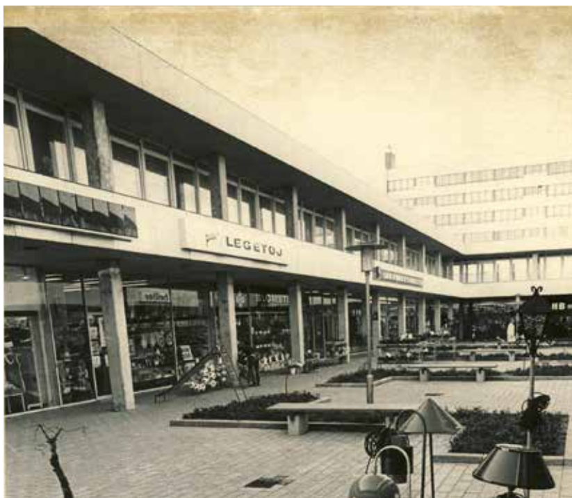
Tårnby Torv set inde fra torvet. Centret blev bygget i tiden 1968-1969. Fotograferet omkring 1975-1979 – muligvis mens Musikbiblioteket lå dér.

Musikbiblioteket blev en succes fra starten. Amager Bladet skrev i slutningen af juni, at 1.200 lånere havde meldt sig ind i løbet af de første små to måneder, ”og det er glædeligt, at 70 % er unge under 20 år”. Bladet kunne også konstatere, at låneinteressen var så stor, at den påregnede begrænsning på de fire plader pr. lån slet ikke kunne overholdes. Man måtte indtil videre indskrænke