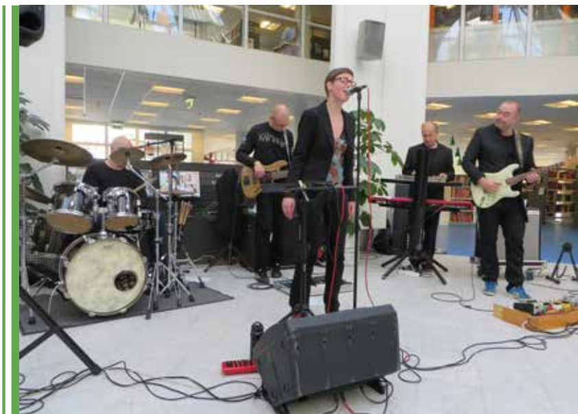
Konserter på hovedbiblioteket – her ved Musikugen i 2014 hvor ”Zebra Among Suits” spiller.

Andre folk synger en melodi og vil have sangens titel at vide. Nogle gange bliver ”samspillet” mellem bruger og bibliotekar helt bogstaveligt! På Tårnby Bibliotek kan man få anbefalinger til, hvad man skal høre uden musiktjenesters algoritmer eller kommercielle interesser. Der kan også hentes inspiration fra Facebooksiden ”Musik i Tårnby” hvor brugere og biblioteket anbefaler og diskutere musik. Selvfølgelig kan man også blive inspireret i den fysiske samling.