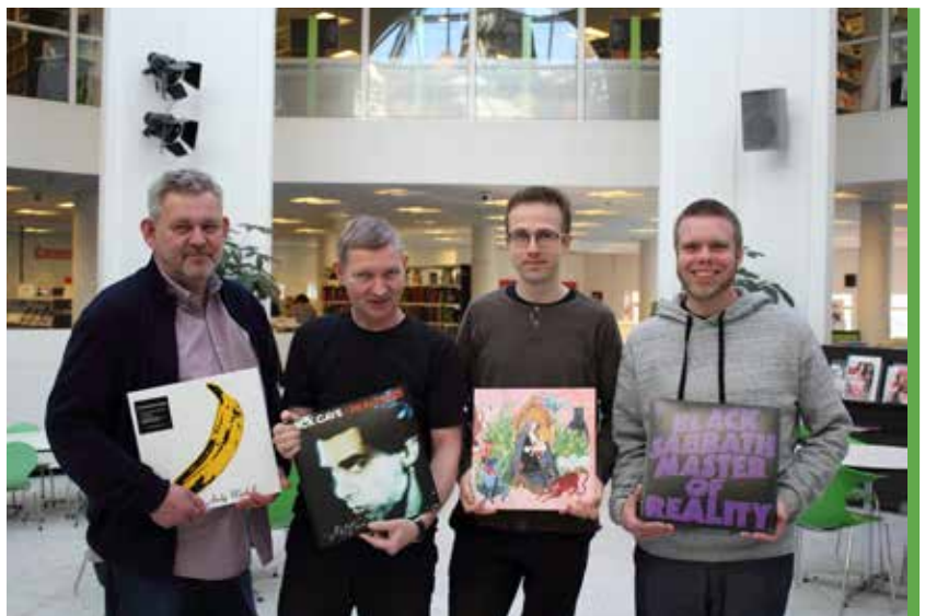
På biblioteket bliver der også anbefalet plader – kaldet ”Det lytter vi til”. Fotograferet i december 2015. Foto: Tårnby Stads- og Lokalarliv, B7066

Det kan være særligt udvalgte musikstykker inden for specialiteter som musik fra andre lande end vesten, udgivelser i boks-sæt, alternative indspilninger af klassiske mesterværker og et katalog af væsentlige udgivelser inden for alle genrer. Fra 2015 blev musiksamlingen også udbygget med en lille skarp samling af gramfonplader, der igen var blevet populære som et kvalitetsmæssigt, fysisk supplement til streaming.