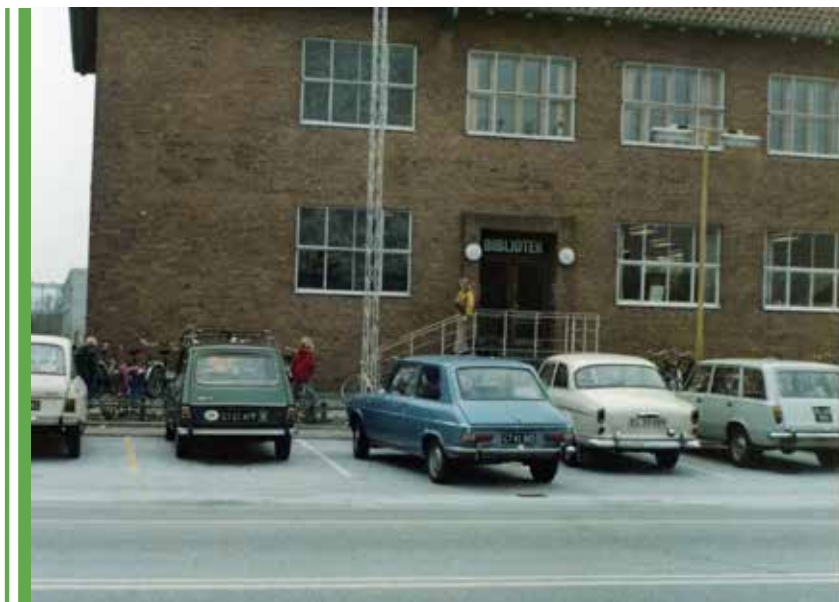
Tårnby Kommunebibliotek - hovedbiblioteket på Tårnbyvej 5. Hovedbiblioteket var netop flyttet til Amager Landevej. Bemærk der er biler med både sorte og hvide nummerplader. Fotograferet i januar 1977. Foto: Tårnby Stads- og Lokalkarkiv, B7036

I 1977 – efter syv spændende opstartsår på Tårnby Torv – flyttede musikbiblioteket sammen med hovedbibliotekets voksen- og børnebibliotek ind i ”den nye sygekasse” på Amager Landevej 89. Forholdene var ikke ideelle, bygningen var ikke velegnet til biblioteksformål, men allerede på det tidspunkt var det nye hovedbibliotek på Kamillevej ved at tage form på tegnebrættet.