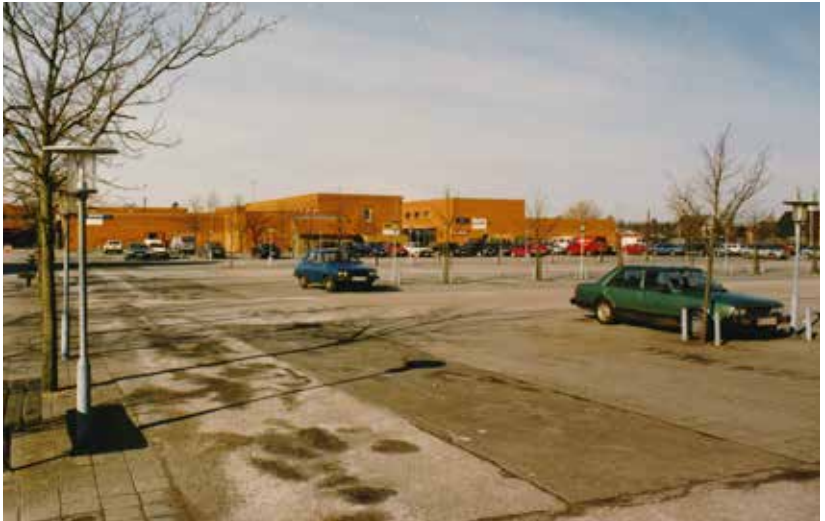
Antenneforeningens område startede ved Ugandavej – vises her med et billede af Vestamager Centret fra 1997 af Helge Hansen.

Allerede i 1994 blev der opkrævet 50 kr. ekstra årligt for hvert medlem af antennefor-