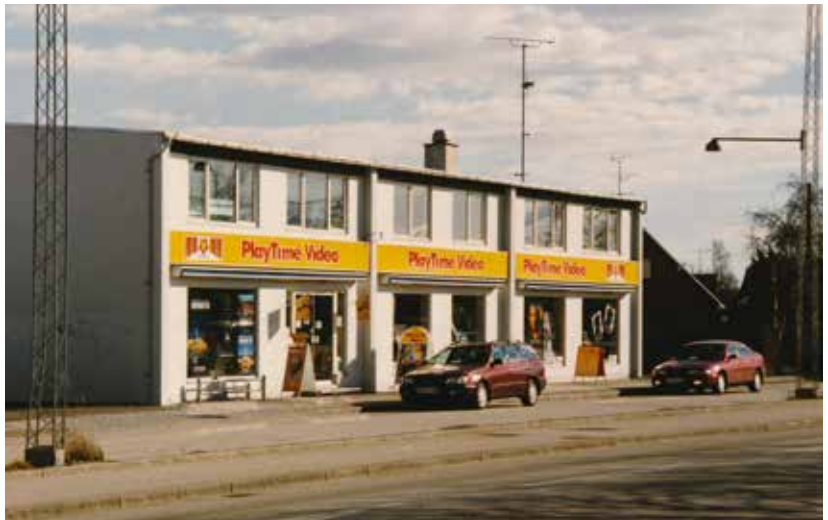
Nicolin Video og PlayTime Video på Kongelundsvej 305-307 fra dengang, hvor der blev lånt VHS-bånd med film til en hyggelig fredag aften.

Den nye forening fik navnet Nøragersminde Antenneforening – forkortet NAF – og blev den stiftet den 19.