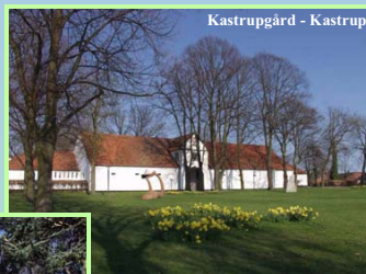
Kastrupgård - Kastrup