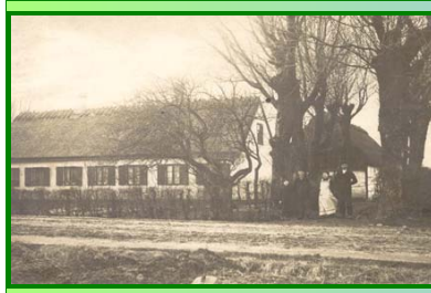
Fædres gave, Tømmerupvej 108.

Tilbage på Tømmerupvej kommer vi til Skelgårde hvor gården ved nr. 92 kan føres tilbage til 1700-tallet og indtil for få siden var ejet af en af de gamle amagerslægter. Nr. 96 er opført i slutningen af 1800-tallet. Så følger Ugandavej, der i gamle dage hed Tømme­rup Strandvej, men blev omdøbt til Marokkovej i 1930'erne. Efter mange protester fra beboerne i Tømmerup blev navnet ændret til Ugandavej i 1947. På Tømmerupvej 100 kommer "Skjeldgård" op­kaldt efter ejerlavet, en af de ældre gårde, der er blevet bygget om.