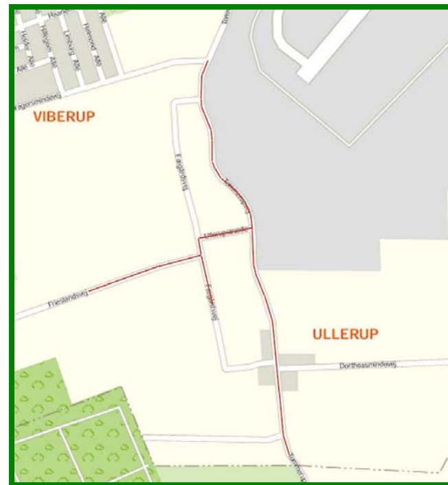
Ruteplan markeret med rødt.

Frieslandsvej 38 er opført i 1842 og i 1853 blev der indrettet et smedeværksted ved siden af boligen. Smedjen fungerede indtil 1883.