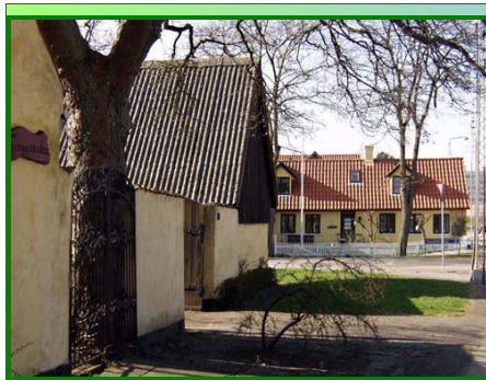
Tinggården, Vestre Bygade 20-22 set mod nord.

Til højre på vejen ligger Vestre Bygade 14 . Huset var i 1830'erne indrettet til smedje men brændte i 1858 og blev genopbygget i grundmur. Vestre Bygade 20-22 kaldet "Tinggården" er den bedst bevarede gård i Tårnby landsby. Den er bygget i 1700-tallet og var fra 1788-1793 tingsted for Tårnby Birketing, mens birkedommeren Christoffer Kindler ejede den. Dengang som nu var den tre-længet.