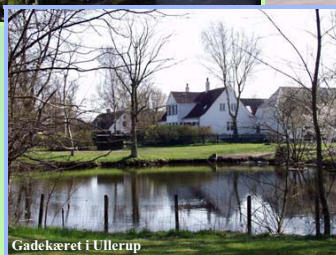
Gadekæret i Ullerup

Udgivet af Tårnby Kommunebiblioteker - Lokalhistorisk Samling - 2005