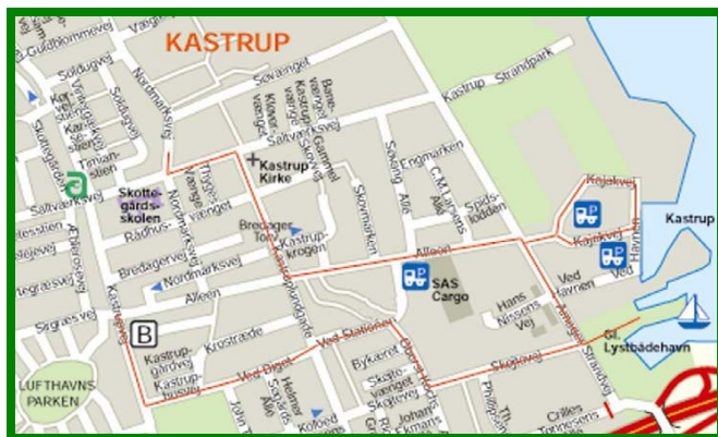
Ruteplan markeret med rødt.

Gårdene lå fra Saltværksvej langs Kastrupgårdsvej, en nu forvunden vej, der løb parallelt med nuværende Kastrupvej tæt ved Kastrupgård. I 1834 brændte 6 gårde og 2 huse og et par af gårdene flyttede i den anledning ud af dette landsbyfællesskab. Foruden landbrug levede folk i Kastrup af fiskeri og arbejdede ved de mange industrier, der fra midten af 1800-tallet blev anlagt langs Amager Strandvej. Befolkningstilvækst og lufthavnens anlæggelse fortrængte fra midten af 1900-tallet de sidste gartnervirksomheder, der flere steder havde afløst de traditionelle amagerbrug med dyrkning af grovere grønsager. I dag er industrivirksomhederne ligeledes forsvundet til fordel for boliger og lettere erhverv.