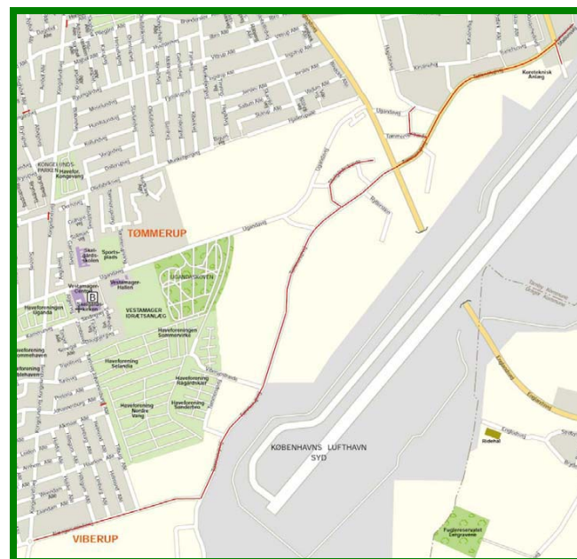
Ruteplan markeret med rødt.

Landsbyens gårde lå oprindeligt langs den vestlige side af Tømmerup Stræde og Tømmerupvej, mens husene lå spredt bag gårdene mod vest ud mod fælleden.