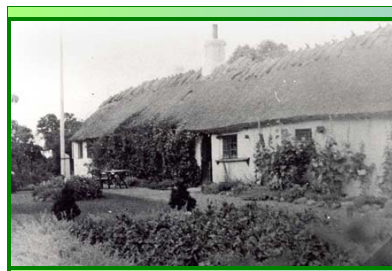
Hvidgård i Ullerup, Tømmerupvej 266.