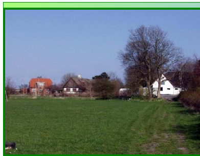
Tømmerupvej set fra Fægårdsvej mod Tømmerupvej 260 og Maglegård. Foto: Dirch Jansen, 2005.

Tømmerupvej 249 ligger oppe på marken godt gemt af vejen men med adresse på Tømmerupvej. Hvis man kører hele vejen igennem, kommer man til St. Magleby. Gården var den første, der blev bygget så langt fra landsbyfællesskabet. Familien, der opførte ejendommen, var som en af de få i landsbyen ikke født på Amager og havde måske derfor ikke så meget imod at bo så langt ude.