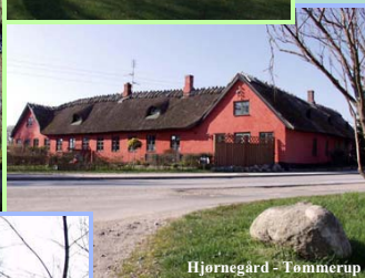
Hjørnegård - Tømmerup