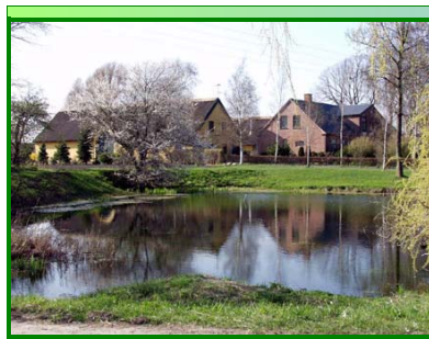
Birkegården ved Høgsbrovej med gadekæret i forgrunden.