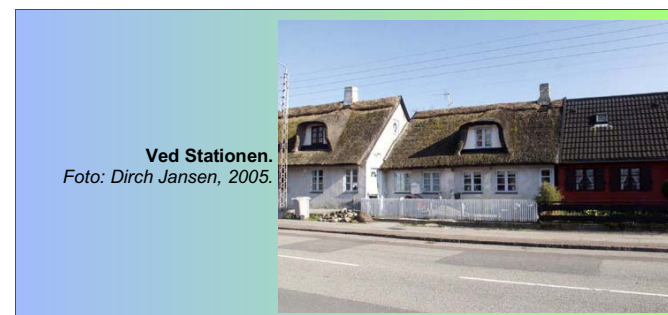
Ved Stationen. Foto: Dirch Jansen, 2005.

Fra Kastrupvej drejes ned ad Ved Diget . Gården ved nr. 28 har været ejet af samme slægt fra 1863 og har ligget her i flere århundreder. Ejendommen undgik branden i Kastrup i 1834, da den lå adskilt fra de andre gårde. Stuehuset er renoveret i 1870.