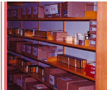
Mikrofilmene stod på rad og række på hjemkaldelseskontoret.