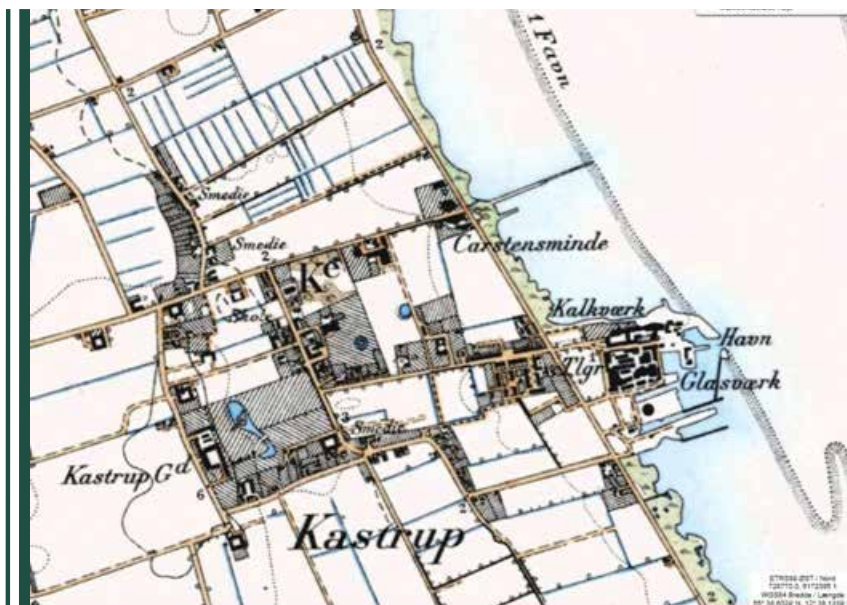
Kort over Kastrup

terne var især brugt på vejene i Sundbyerne inden Sundby blev en selvstændig kommune i 1896. I Sundbyerne, boede der flere mennesker, og derfor var der brug for bedre veje, så vejene ikke blev et stort uhygiejnisk ælte. Men Sundbyernes veje skulle også rumme alle andre på Amager, der skulle til og fra København. Det gjaldt f.eks. alle landbrugerne, som skulle afsætte deres afgrøder på Grønttorvet.